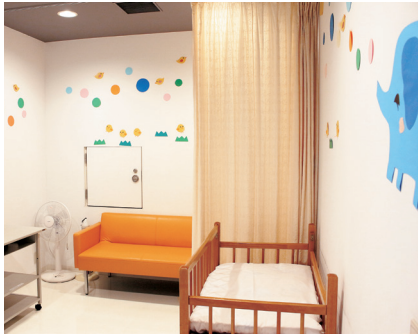
えんぱーく授乳室の様子

に授乳室がある施設の記載があります。えんぱーくの総合受付で配布およびご案内をするとともに、保育課、市民課とも連携し、周知を行っていきます。今後とも、子育て環境の一層の充実を図っていきます。