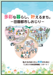
第六次塩尻市総合計画のイメージ

「多彩な暮らし、叶えるまち。―田園都市しおじり―」 私たちのありたい未来のために「しおじり未来投資戦略」スタート! 本市を取り巻く環境・社会構造は大きく変化し、今後もより大きく、速く、厳しくなります。このような状況の中、限られた行政の経営資源を有効に投資しながら、持続可能な未来の地域社会を構築していくために、「総合計画」と位置おじり未来投資戦略」と位置