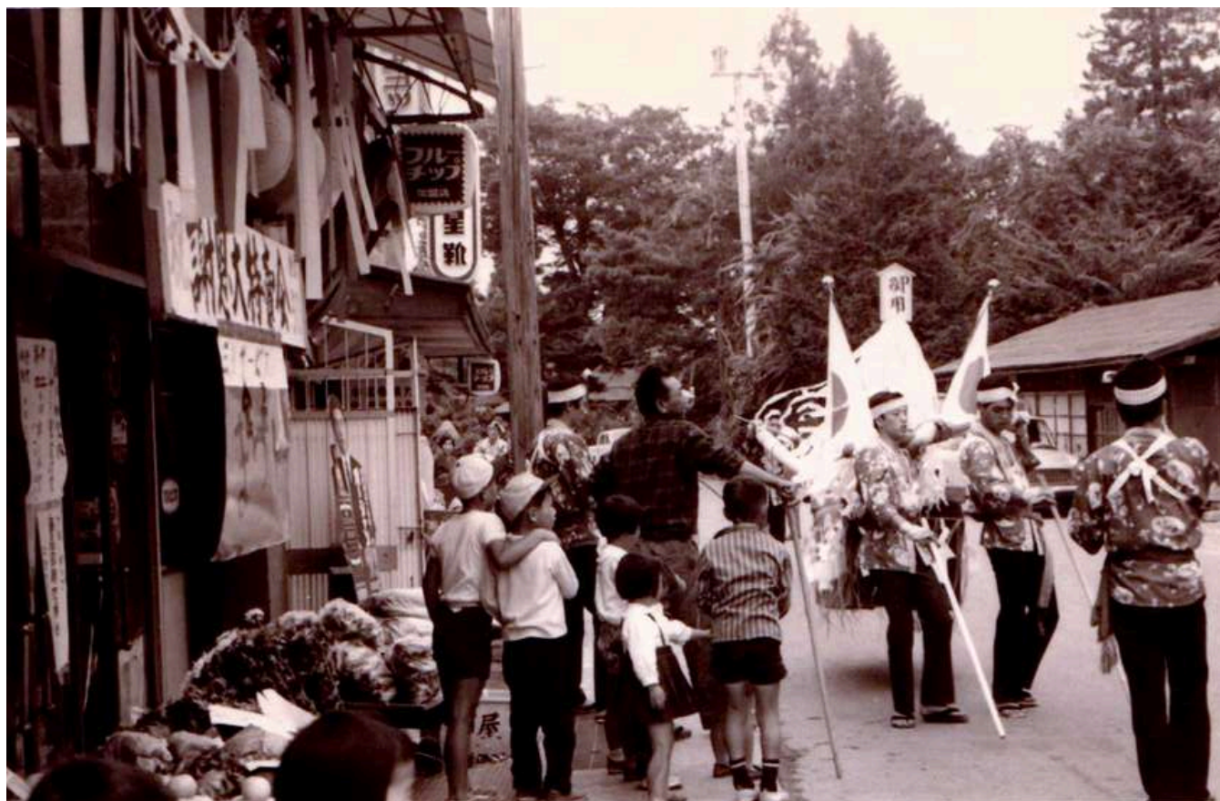
蔦茂商店・矢島屋