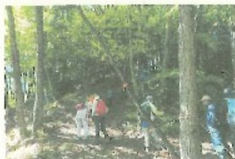
前回の妙義山城登山