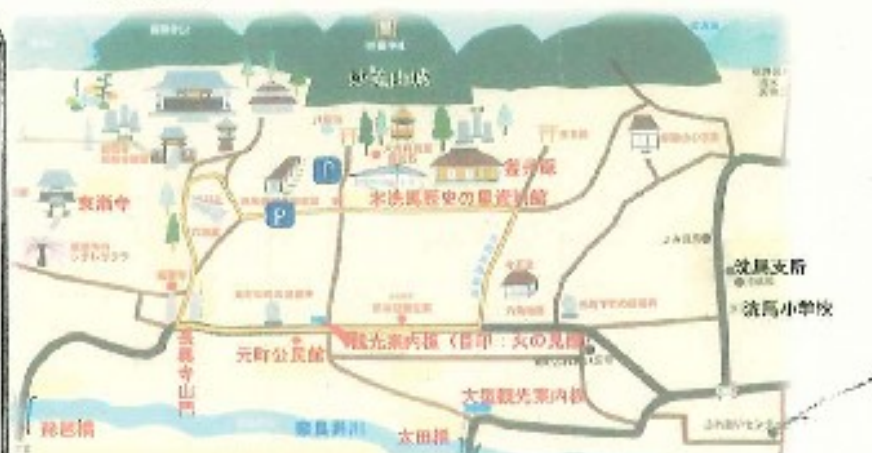
「本洗馬歴史の里資料館」でナビ検索可能です。