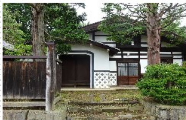
現在の熊谷医家「生々堂」