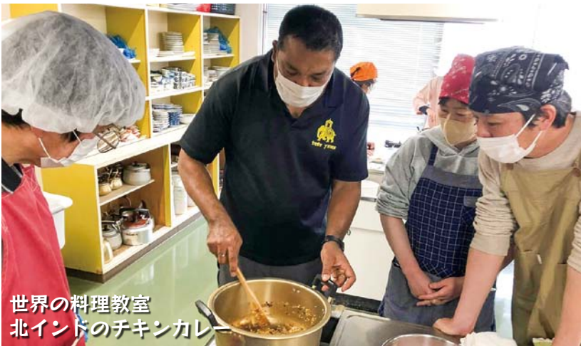
世界の料理教室 北インドのチキンカレー