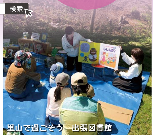
里山で過ごそう 出張図書館