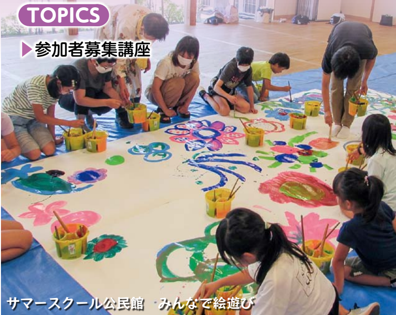
サマースクール公民館 みんなで絵遊び