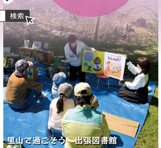
里山で過ごそう 出張図書館