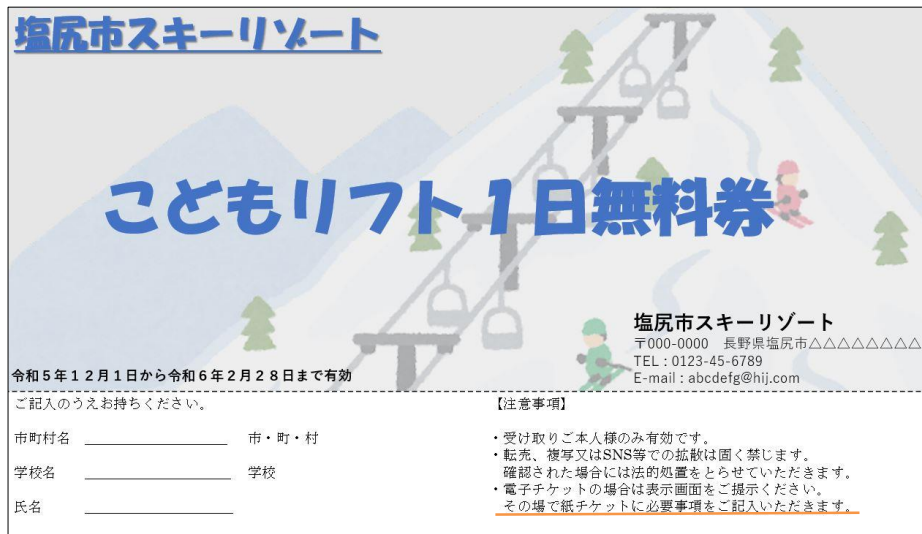
チケット類内に 利用方法を記載