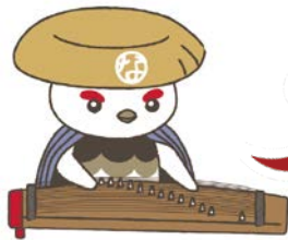
デザイン制作=高校生× 絵画・開学動-9ルデザインカガマ-