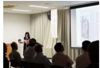
昨年の広島平和教育研修(左)と平和祈念のつどい(上)の様子