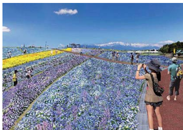
完成予定イメージ図

平成31年の春に、信州スカイパークをメイン会場に、第36回全国都市緑化 信州フェア「信州花フェスタ2019～北アルプスの贈りもの～」を開催します。 全国都市緑化フェアは、国内最大級の花と緑のイベント で、長野県では初めての開催です。このイベントの出展 者およびボランティアを募集します。