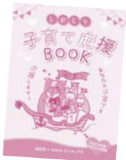
※平成29・30年度版です。

発行費用は広告料収入によってまかなうことで、(株)サイネックスが編集、印刷を行い、市の子育て情報を発信します。今後、同社が市内の各事業所を訪問し、広告を募集する場合があります。本事業の趣旨をご理解いただき、ご協力をお願いします。