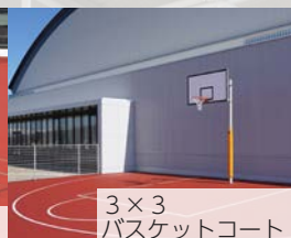
3×3 バスケットコート