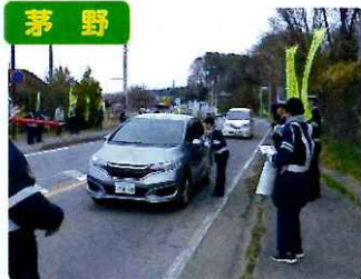
茅野 国道20号線での啓発活動