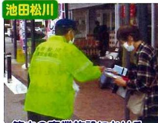
池田松川 管内の商業施設における、 交通安全広報啓発活動