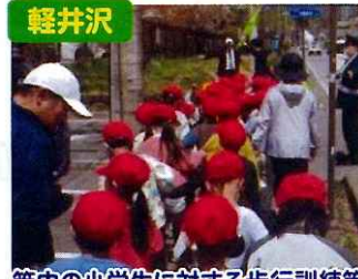
軽井沢 管内の小学生に対する歩行訓練等 交通事故防止啓発指導を実施