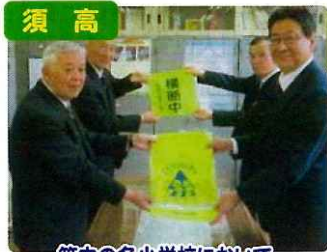
須高 管内の各小学校において、 新入学児童へハンドセルカバーを贈呈

交通安全協会は、交通事故をなくすため、様々な活動を行っています。活動の一例を紹介します。