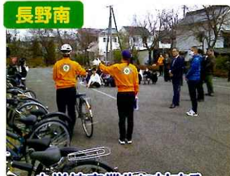
長野南 小学校卒業生に対する 自転車安全教室の実施