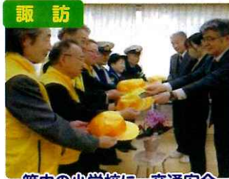
諏訪 管内の小学校に、交通安全 啓発品(黄色い帽子)を贈呈