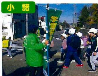
小諸 横断歩道マナーアップ作戦