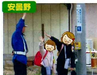
安曇野 通学路における見守り活動