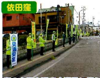
依田窪 春の全国交通安全運動に伴う 交通指導所の実施