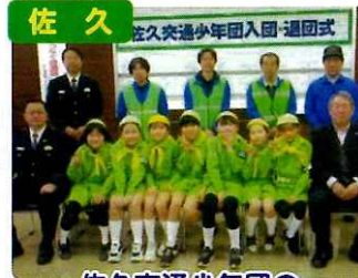
佐久 佐久交通少年団入団・退団式