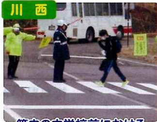
川西 管内の中学校前における 横断指導の実施