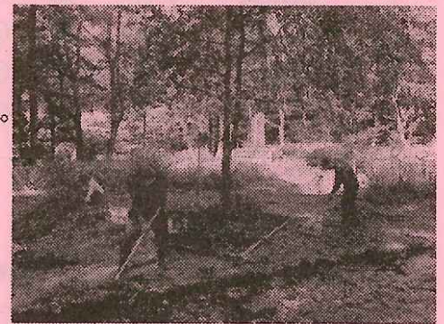
善知鳥峠分水嶺公園整備