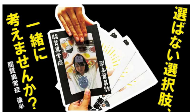
脂質異常症 (前半・後半)