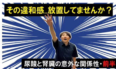
尿酸と腎臓の意外な関係性 (前半・後半)