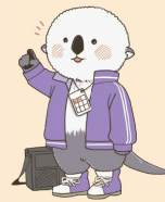
塩尻市健康推進キャラクター ラジッコ©