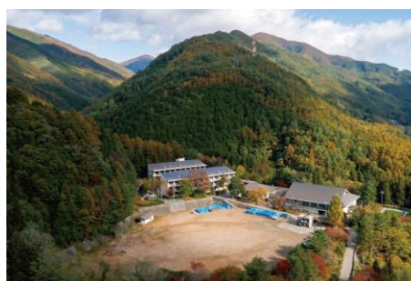
yama-niwa 全景（旧榎川中学校）