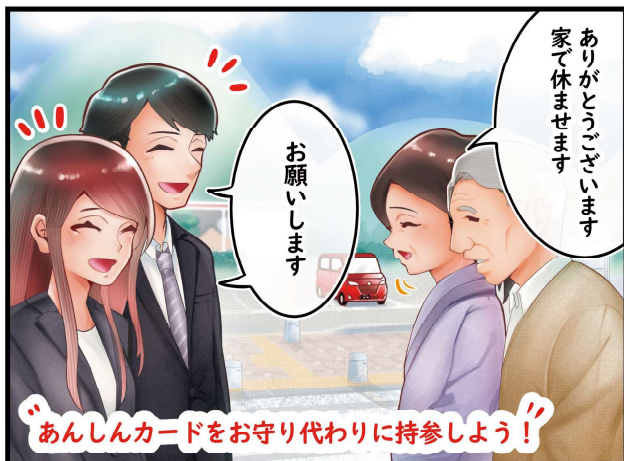
作画：新良木（あらざぎ）さん