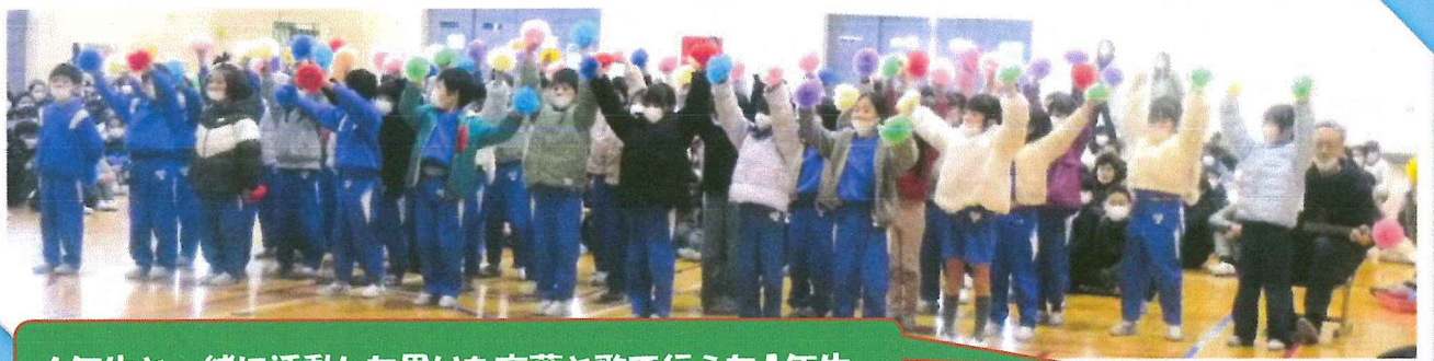
6年生と一緒に活動した思いを言葉と歌で伝えた1年生