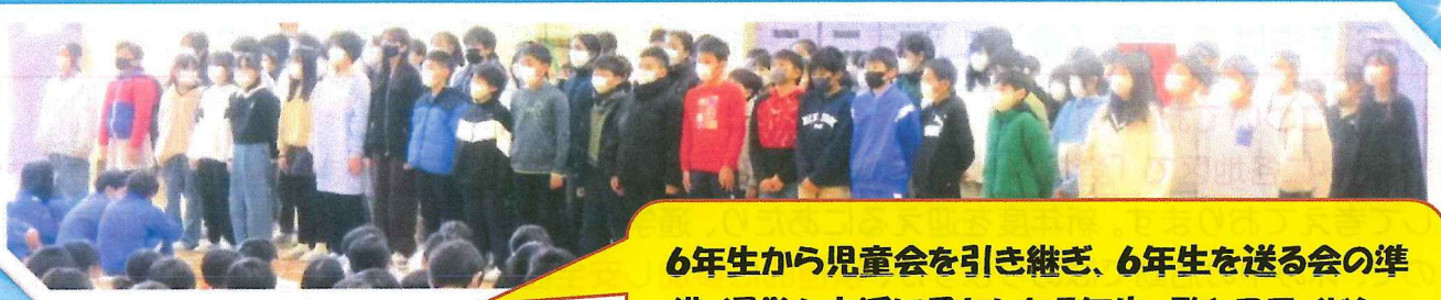
6年生から児童会を引き継ぎ、6年生を送る会の準備・運営を立派に果たした5年生。歌とスライドショー、そして会場の装飾と頑張ってくれました。