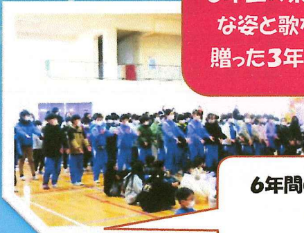
発言形式で 6年生の素敵 な姿と歌を 贈った3年生