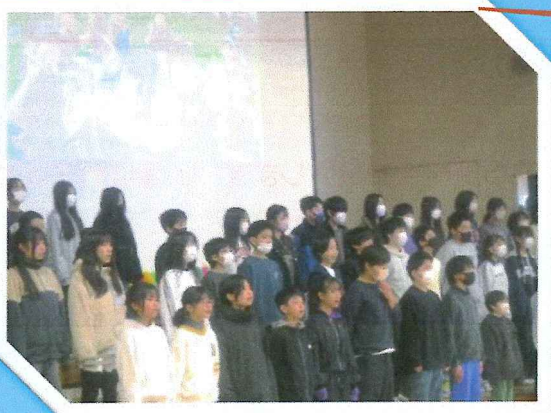
呼びかけと素敵な2部合唱を披露してくれた6年生。さすがの歌声を在校生に送ってくれました。