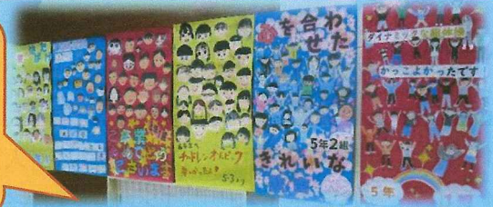
全校から 6年生に 向けの メッセージ