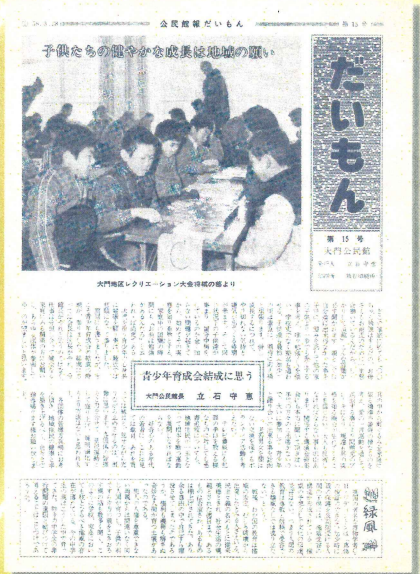
(青少年の健全育成について)