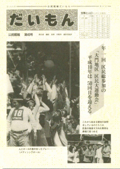
(第50回大門地区区民大運動会)