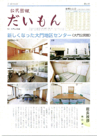
(大門公民館改築完成)