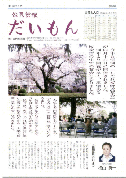
(しだれ桜野点茶会)