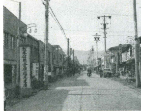
大門商店街 (昭和30年頃)