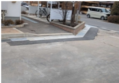
高出国鉄変電所北線