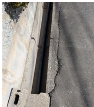
みどりヶ丘団地南線