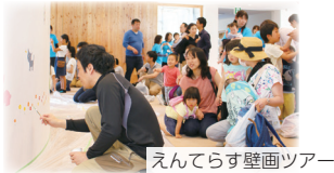
えんてらす壁画ツアー