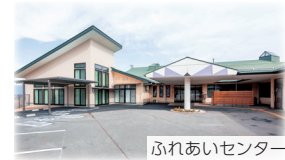
ふれあいセンター東部