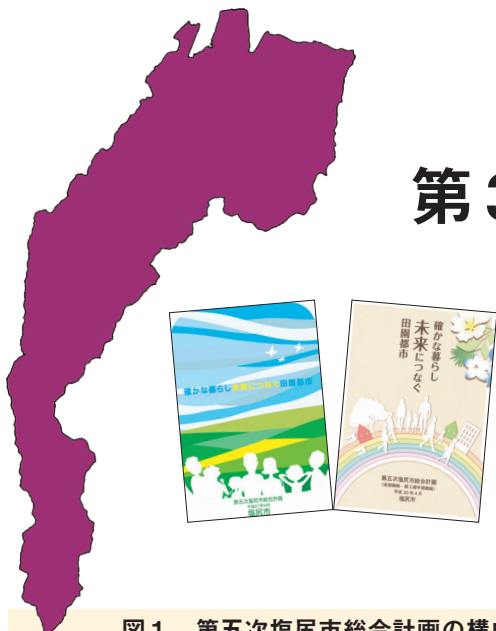
図1 第五次塩尻市総合計画の構成