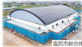
塩尻市総合体育館