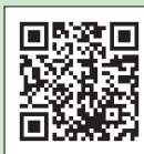
塩尻市ホームページ

現在、新型コロナウイルス感染症に伴い、市主催のイベントは今後の動向を見ながら随時開催を判断しています。 今月号に掲載しているイベントの開催日については、すべて5月21日現在の予定となっています。 以降の開催日延期・中止の情報については、市ホームページや市公式 SNS などでお知らせしますので、ご確認ください。