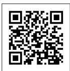
県 Twitter アカウント

県内の新型コロナウイルス感染症に関する情報は、長野県の公式 Twitter、LINE アカウントでご覧いただけます。また、市内の情報は市ホームページの「新型コロナウイルス関連情報」( https://www.city.shiojiri.lg.jp/kurashi/kenko/attention/koronatyui.html ) をご覧ください。