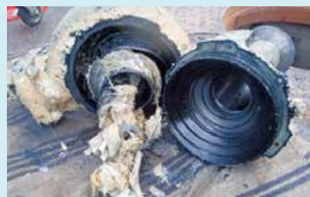
下水道ポンプの故障により、ポンプを分解した時の写真