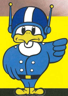
長野県警察 マスコットキャラクター 「ライボくん」