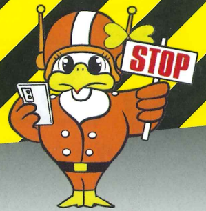
長野県警察 マスコットキャラクター 「ライビィちゃん」