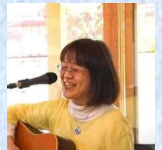
さとさとみ (くじら号森の歌姫)