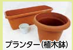
プランター(植木鉢)