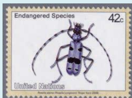
アルプススリボシカミキリ 「絶滅危惧種」 国連(ニューヨーク)