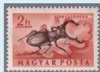
ヨーロッパミヤマクワガタ ハンガリー