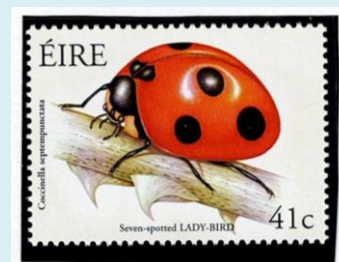
ナナホシテントウ アイルランド