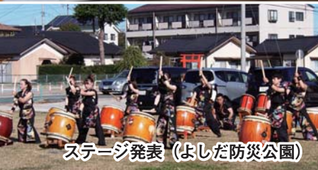
ステージ発表 (よしだ防災公園)