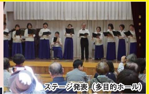
ステージ発表 (多目的ホール)

それ以外にも、お楽しみ抽選、ポップコーンサービス、抹茶サービスなど数多くのイベントを開催しました。