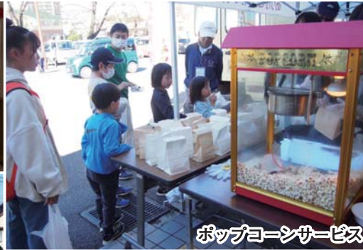
ポップコーンサービス