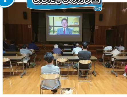
いつまでも脳を元気に保つために