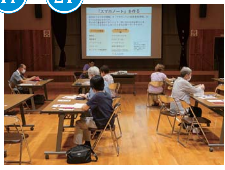
スマートフォン活用講座