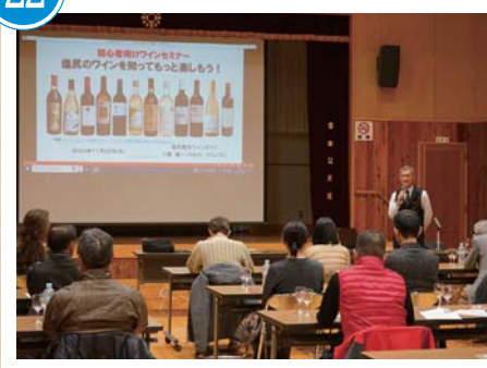
初心者向けワインセミナー