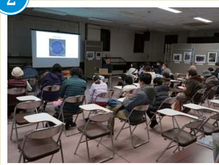
まちかど星空観察会