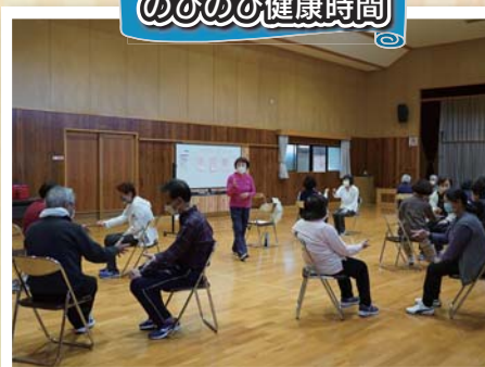
体も心もリフレッシュ!! 5月~3月まで