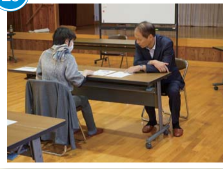
空き家対策啓発講座