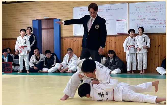
広丘・吉田・高出地区少年少女柔道大会（12月23日）