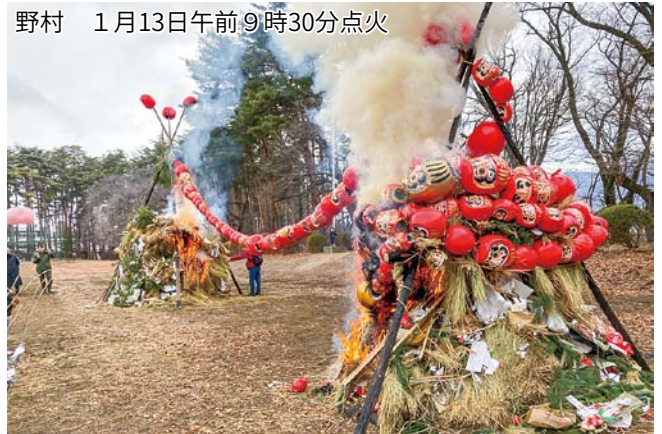
野村 1月13日午前9時30分点火