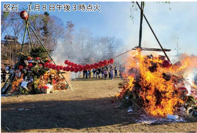
堅石 1月8日午後3時点火