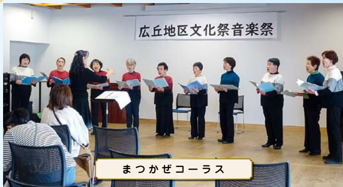
まつかぜコーラス