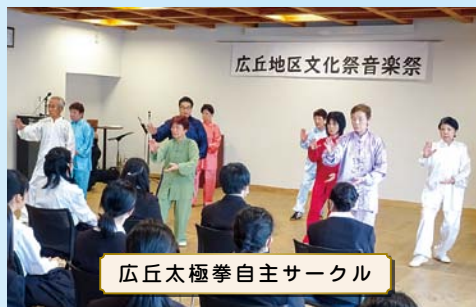
広丘太極拳自主サークル