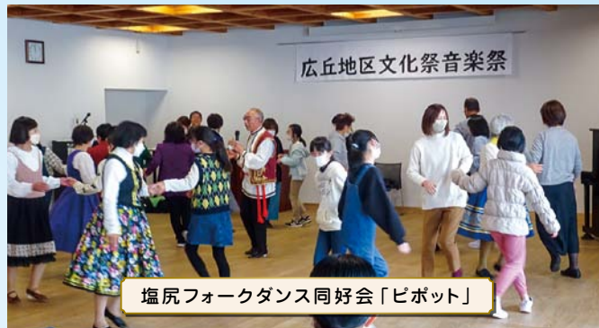
塩尻フォークダンス同好会「ピボット」