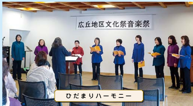
ひだまりハーモニー