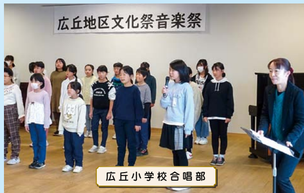
広丘小学校合唱部