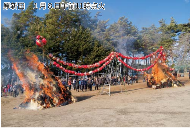
原新田 1月8日午前11時点火