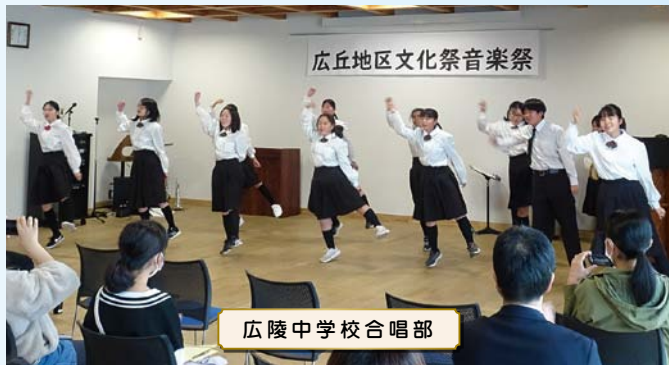
広陵中学校合唱部