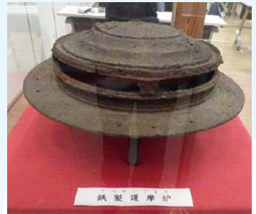
広丘で発掘された護摩炉