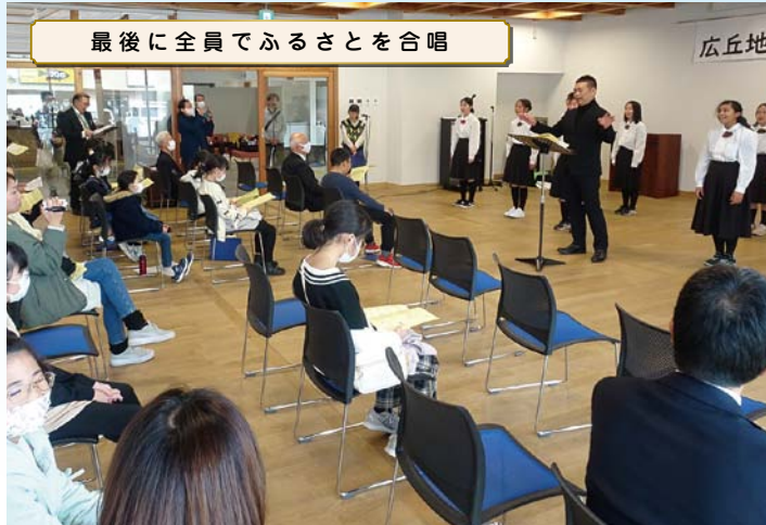
最後に全員でふるさとを合唱