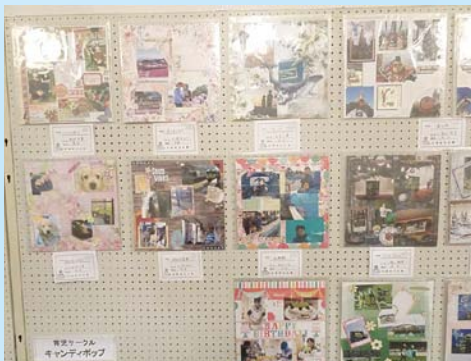
キャンディポップ