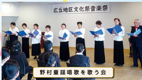
野村童謡唱歌を歌う会