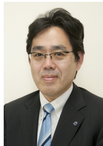
川島隆太教授プロフィール

東北大学医学部卒業。同大学院医学研究科修了。スウェーデン王国カロリンスカ研究所客員研究員、東北大学助手、講師を経て、現在同大学教授。医学博士。脳のどの部分にどのような機能があるのかを調べる「ブレインイメージング研究」の日本における第一人者。学習療法・脳健康教室の生みの親の一人。