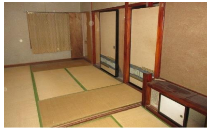
2階北側 和室2間続き