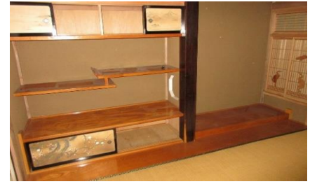
2階北側 和室床の間