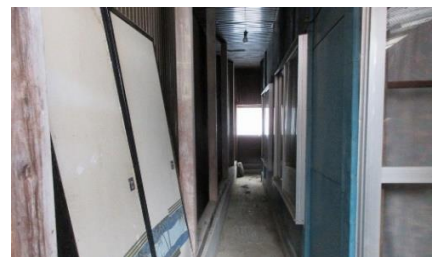
裏庭に抜ける土間通路