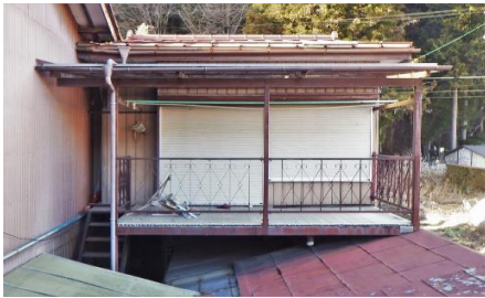
2階北側 ベランダ(1階倉庫と階段で繋がる)