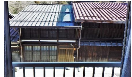
2階南側 和室窓からの眺め