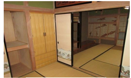
2階北側 和室2間続き