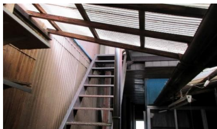
2階北側ベランダへの階段