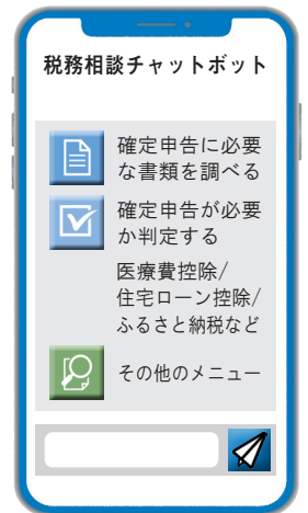
AIチャットボットのイメージ