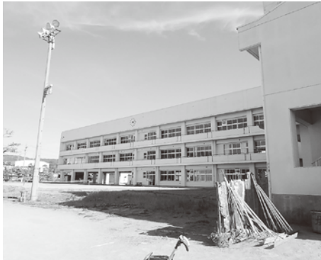
塩尻中学校 塩尻中学校大規模改修工事（平面図）

A 建築主体工事、電気設備工事、機械設備工事を分離発注としており、今回、議会に諮っているのは建築主体工事である。建築主体工事の対象となっていない箇所も、LED化等