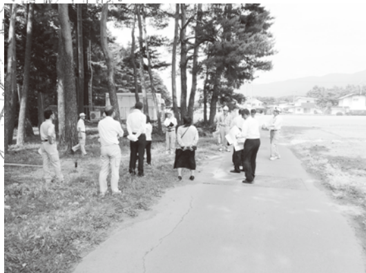
新規路線箇所視察の様子