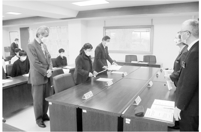
要望書の提出の様子

塩尻市議会は、平成23年度から市民に開かれた議会を目指し市内各地区において「議会報告会」を開催してきました。 また、若い世代に市政への関心を持ってもらうための主権者教育も兼ね、平成29年度と令和元年度には、市内の高校3校においても「議会報告会」を開催し、本年度も開催を計画していました。 しかし、新型コロナウイルスの感染拡大防止のため、高校に向向いての「議会報告会」の開催はかないま