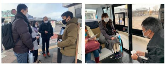
協力事業者から試乗者へ事業説明