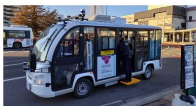
1/11始発便(市民4名、高校生2名乗車)