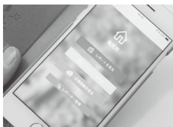
道路の損傷と位置情報を通報するアプリ「塩レポ」

答 28年度107件、29年度2月までは90件の通報があり電話、メール、ファックスで対応している。今後、「塩レポ」の運用も検討したい。