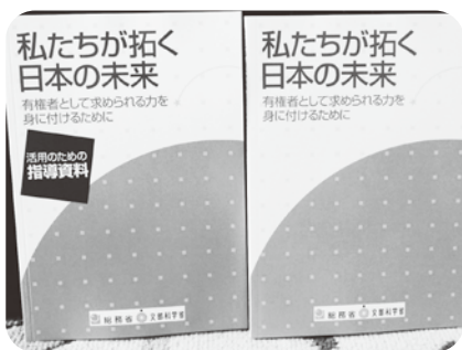
主権者教育のための高校副教材