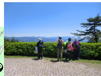
景色がきれい 眺めが良い