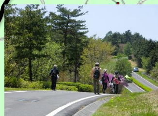
登り下りがあるため、水分補給と休憩をとりながら