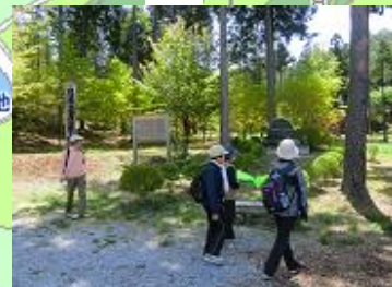
日本ど真ん中の標柱