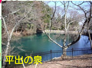
車に注意! 平出の泉