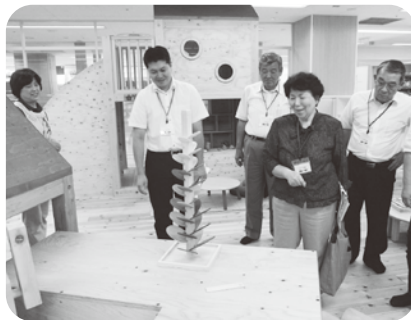
「こども広場 あ・そ・ぼ」を視察

福祉教育委員会は9月20、21日に開催し、付託された平成23年度塩尻市一般会計歳入歳出決算認定について、24年度補正予算など7件の議案および請願2件、陳情1件については、慎重審査の結果、いずれも原案のとおり認定・可決・採択すべきものと決しました。