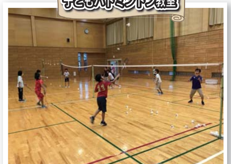
第1・3木曜日に開催