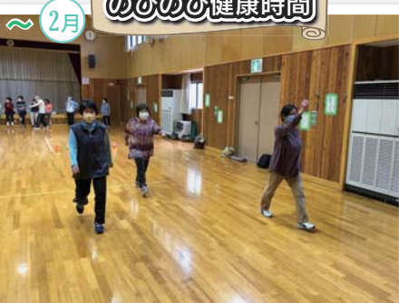
体も心もリフレッシュ !!