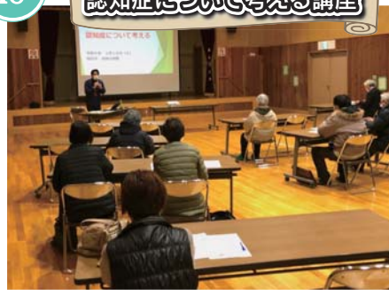
ネガティブにならない為に