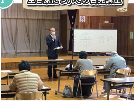
昨今、社会問題の一つです