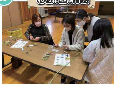
ステキな飾りが出来そうです