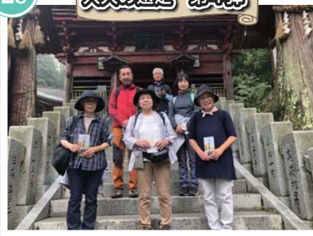
秋の牛伏寺を訪ねる