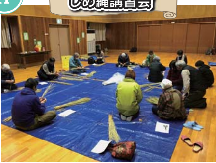
卯年がいい年でありますように