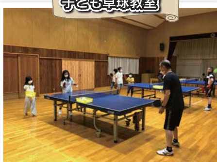
第2・4木曜日に開催