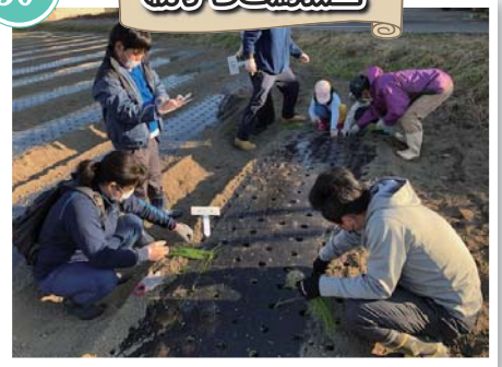
親子で玉ねぎを植えてみよう !!