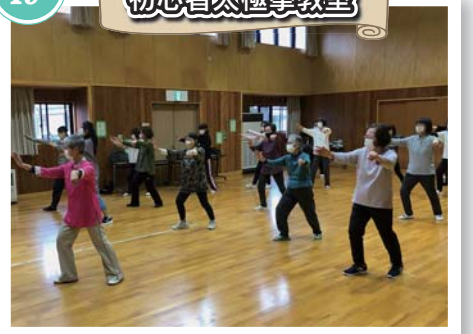
呼吸に合わせてゆっくりと