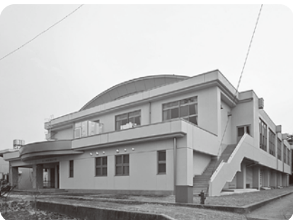
避難所に指定されている広丘小学校体育館