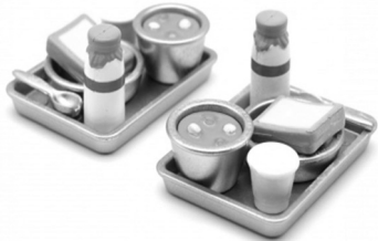
学校給食レシピサイト「こんこんレシピ」でメニューを掲載中