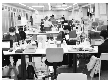
会計年度任用職員が多く働いている市役所

◆ 農業の課題解決は 問 市内農業の課題と解決策についての考えは。 答 農業従事者の高齢化、後継者不足などにより、農家数が減少している。農業の振興、農業経営の収益と効率化の改善支援を強化する。具体的には9月議会の一般質問で取り上げられた、「肥料価格高騰対策」は新年度予算化において国、県の上乗せを目指すほか、土地改良事業における地元負担の軽減など、持続可能な農業を推進していく。 (市長)