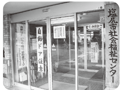
社会福祉センター正面入口