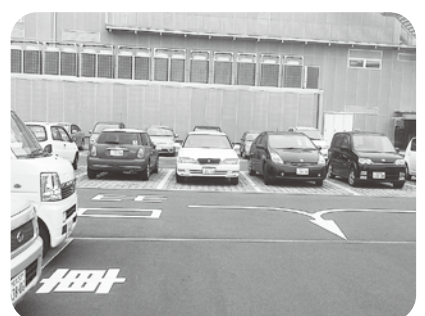
利用率の高いえんばく平面駐車場