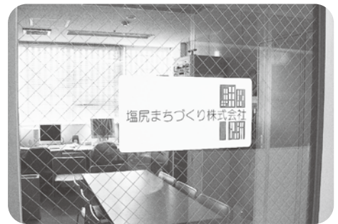
再生が望まれる「塩尻まちづくり株式会社」

の同時期に比べ15%以上減少 していること。直近の決算等 の経常損益が赤字であること 平成22年12月から1年間に限 り支給対象になる。