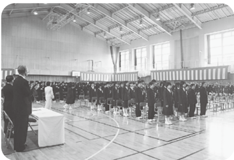
中学校での充実した教育環境を