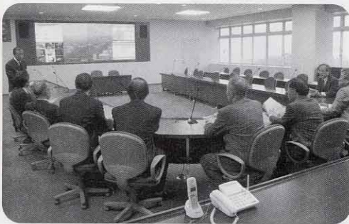
姫路市防災センター (兵庫県姫路市)

気遣い、挨拶等が公聴の場でも取り上げられ、高い評価を受けており、職員の接遇面の向上につながっているとのことでした。