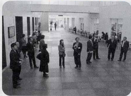
岡崎市図書館交流プラザ