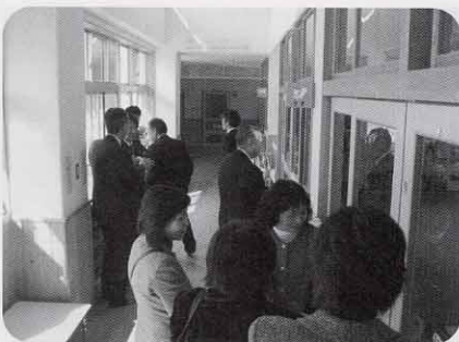
認定こども園「翼幼保園」 (愛知県高浜市)

障害者に対する『就労現場の確保と低賃からの脱却』をテーマに、授産施設の視察をしました。法人の代表は長野県のアドバイザーでもありますが、アイデアを生かした商品開発や、まめに足を使った事業展開をし、今のところ補助金なしで運営されており、月額工賃5万円から10万円を目標としていて、地域社会での自立の意気込みを感じました。