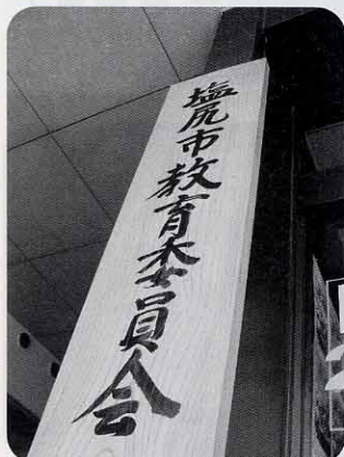
学校教育環境の改善を教育委員会に求む

問 小学校から継続した問題が原因ならば、今回の事案は予期できたのか、対応が適切でなかったのか。(青柳)