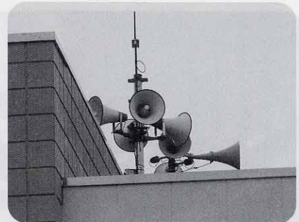
今後整備が進む同報系防災行政無線

設・整備事業などのほか、支所に係る予算や施設整備、老人医療事務費や後期高齢者医療運営費など高齢者の健康に係る部分、水質やごみ処理、斎場や霊園に係る部分など市民生活に直接関係のある予算についての審査を行いました。平成20年度補正予算3件については事業確定によるものが主でした。