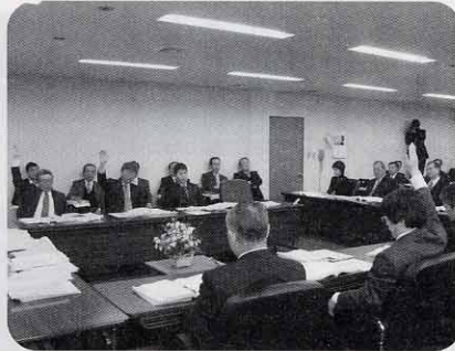
委員から提出された一般会計予算の修正案は賛成多数で可決

当委員会に付託された案件は13件であり、平成21年度一般会計予算の審査が主で、新体育館測量調査委託料については修正案が出されました。今後議論を深める必要があり、昨今の経済状況の悪化を考えると、この調査